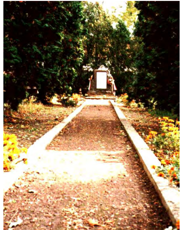
A feltaláló sírja az Irinyi utca 8. szám alatt