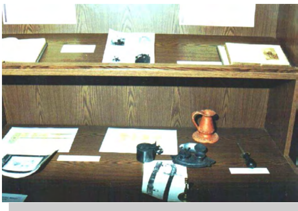
Az ideiglenes kiállítás részlete (Irinyi u. 1.)

December 19-én beindítja az első robbanásmentes gyújtókat gyártó üzemét a Teréz-városban (Nyár utca 234).